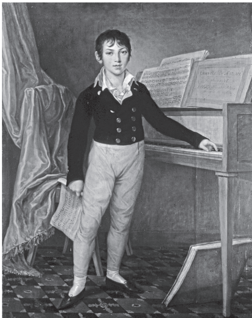
Abb. 1 Meyer Beer im Alter von 11 Jahren, Ölgemälde von Friedrich Georg Weitsch (1802)